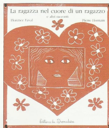
Florence Faval e Pierre Hornain, La ragazza nel cuore di un ragazzo e altri racconti , Venezia, Editions du Dromadaire, 2006, euro 12,00

Al di là delle storie, sorprende l'uso della lingua: riuscita nel gioco delle assonanze e nell'evocare immagini e poi precisa, ricerca-